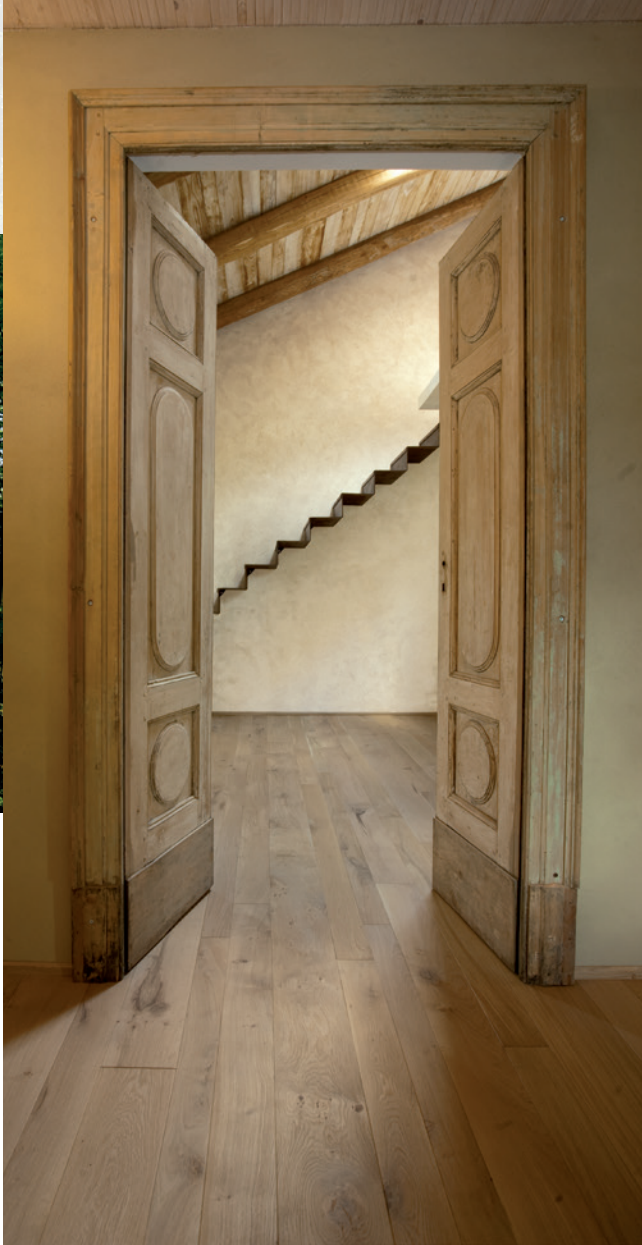
Finiture ad olio personalizzate